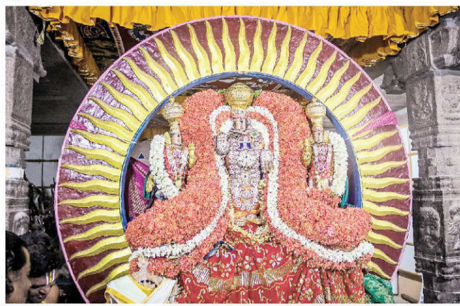
சென்னை மேற்கு சைதாப்பேட்டை ஸ்ரீ அலர்மேல்மங்கை தாயார் சமேத ஸ்ரீ பிரசன்ன வேங்கடநரசிம்ம பெருமான் தேவஸ்தானத்தில் நடைபெற்ற சித்திரை பிம்பமேதல் விழாவை முன்னிட்டு சூரிய பிரபையில் பக்தர்களுக்கு அருள்பாலித்த உற்சவம்.